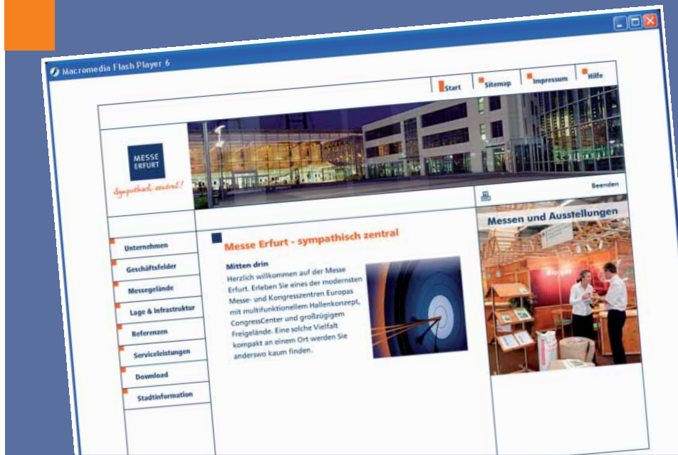
Kompakt auf 12 cm Durchmesser präsentiert die Messe Erfurt AG ihre gesamte Ausstellungsfläche von 46.670 m 2 .