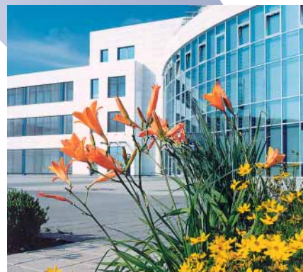
Bis zu 1.600 Personen können im CongressCenter tagen.

Die Voraussetzungen oder besser die Zutaten der Messe Erfurt stimmten von Anfang an. Seit einigen Jahren verzeichnet Vorstand Johann Fuchsgruber steigende Besucher- und Ausstellerzahlen. Das beweist den Erfolg der drei Geschäftsfelder. Messen und Ausstellungen, Kongresse und Tagungen sowie Events und Konzerte finden auf dem zweitgrößten Messeplatz Ostdeutschlands statt. Mehr als eine halbe Million Besucher und 3.982 Aussteller kamen allein 2006 zu 151 Veranstaltungen. Zahlreiche Eigenveranstaltungen wie „Grüne Tage Thüringen“ oder „Reiten-Jagen-Fischen“ gehören inzwischen zur Tradition. Parallel etablieren sich Messethemen wie Rapid-Technologie oder Nachwachsende Rohstoffe. Das ZDF gehört zu den Wiederholungstätern in Sachen Live-Sendungen aus Erfurt und mit „Blockbustern“ wie dem Deutschen Zahnärztetag 2006 oder dem