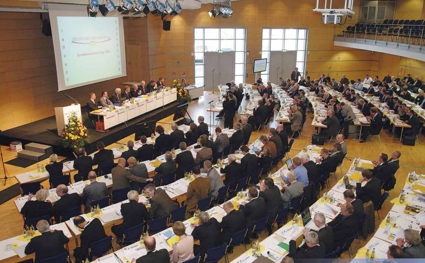
Blick in den Carl-Zeiss-Saal des CongressCenters.