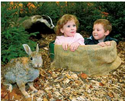
Die erste Messe REITEN-JAGEN-FISCHEN fand 1998 statt.

Auf Wachstumskurs will die Messe Erfurt auch in den nächsten fünf Jahren bleiben. Mit der Weiter- und Neuentwicklung von Messethemen soll das gelingen. So startet im Jubiläumsjahr sport.aktiv – DIE OUTDOORMESSE. Was sonst noch in der Visionenküche brodelt? Die Zeit wird es zeigen. Heute Pferdeturnier, morgen Wellnessoase, übermorgen Designerschmiede – die Welt ändert sich fast täglich im Messezentrum. Aber die einzelnen Länder dieser Welt müssen den Besuchern gefallen. Darauf kommt es an und das ist wie in einem guten Restaurant. Es geht nicht nur ums Essen, sondern um ein Rundumerlebnis vom Angebot bis zur Zufriedenheit.